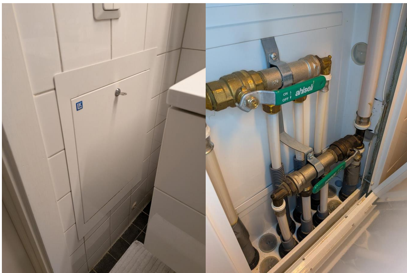
Ovan: Exempel på placering och utseende på huvudventil i lägenhet.

Medlem: Vid vattenläcka i lägenheten är det viktigt att direkt stoppa vattnet att spridas, genom att stänga av huvudventilerna i lägenheten och försöka stoppa spridningen med exempelvis handdukar och hinkar.